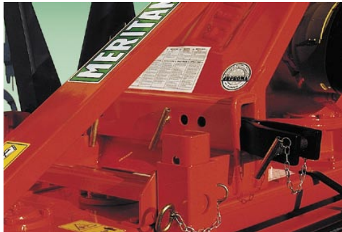
Attacco al trattore regolabile ed oscillante (fornito di serie). Regolazioni barre livellatrici con perni (fornito di serie). Riduttore centrale con cambio di velocità (fornito di serie).

Verstellbarer Kipp-Anschluss an den Traktor - serienmäßig geliefert. Einstellung der Nivellierstangen mit Zapfen - serienmäßig geliefert. Zentralgetriebe mit Gangschaltung - serienmäßig geliefert.