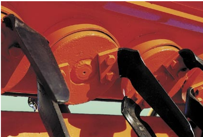
Denti a lama montati su rotore con protezione parasassi (fornito di serie). Zahnklinge auf Rotor mit Steinschutz - serienmäßig geliefert.

Sollevatore idraulico per seminatrice nella versione con 1 o 2 pistoni (fornibile a richiesta).