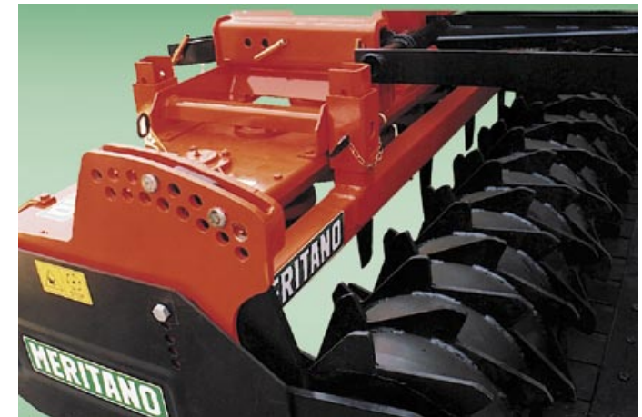
Regolazione del rullo con perni (fornibile a richiesta). Einstellung der Walze mit Zapfen - auf Anfrage lieferbar.

Verstellbarer Kipp-Anschluss an den Traktor - serienmäßig geliefert. Einstellung der Nivellierstangen mit Zapfen - serienmäßig geliefert. Zentralgetriebe mit Gangschaltung - serienmäßig geliefert.